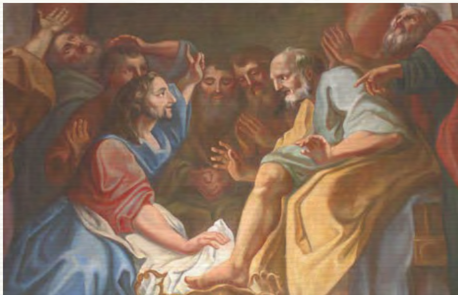
Bild: Fußwaschung